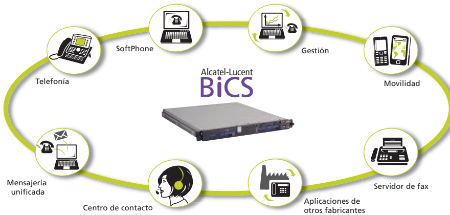
Figura 2. Alcatel-Lucent BiCS: Un completo sistema de comunicación en un único servidor